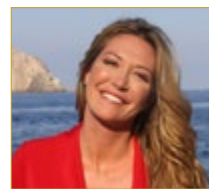
TESSA GELISIO Conduttrice Grand Gourmet